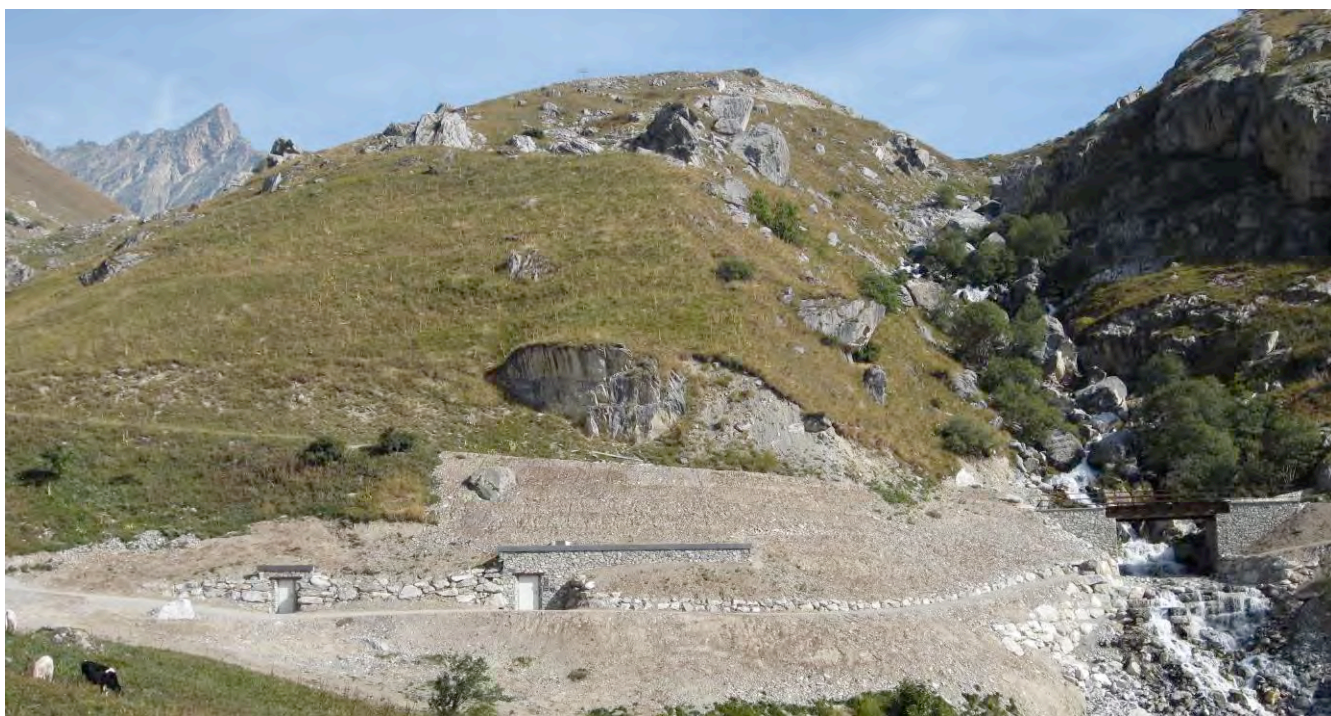
L'opera di presa sul torrente Maurin e il nuovo ponte delle Combe - 21 settembre 2013.

L'impianto, compreso tra Ponte delle Combe e Ponte delle Fie, nella valle del Maurin - ramo di testata del torrente Maira - è costituito da una presa a trappola localizzata sotto il nuovo ponte stradale, un dissabbiatore, una condotta forzata interrata di lunghezza circa 1 km e una centrale di produzione in pozzo con restituzione dell'acqua utilizzata a monte del Rio di Stroppia.