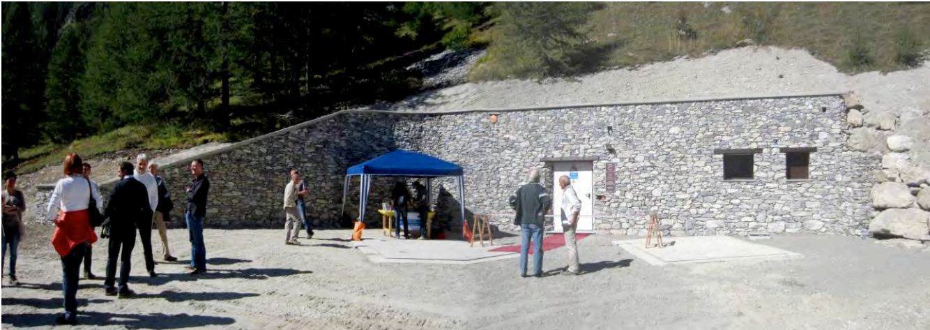
L'esterno della centrale idroelettrica Delle Fie Maurin- 21 settembre 2013.